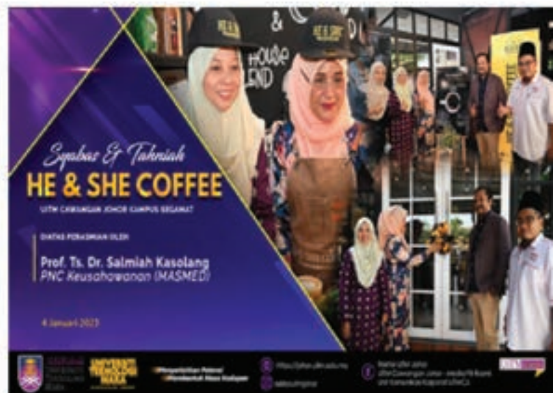
Sumber gambar keseluruhan laporan ini adalah daripada penulis.