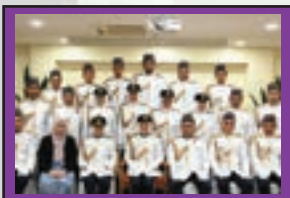
4 PEGAWAI KEHORMAT KESATRIA UiTM CAWANGAN JOHOR